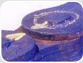
Gelenkrost Link rust