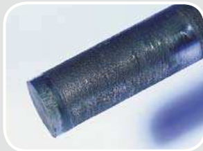
Pittingbildung Pitting formations