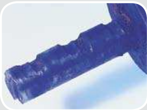
Verschleiß bei Kettenbolzen durch Mangel-schmierung Early wear of chain pin due to inadequate lubrication