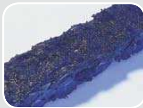
Verschmutzung Contaminated chain